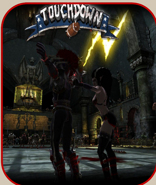
Az Árnyékok tánca a gólvonalon: Sötétszívű Flyonth és Lilith

a Hercegnek akinek nem maradt más dolga, mint a gólvonalon túlra futni a labdával. Az Árnyékok megszerezték a vezetést 0-1. A középkezdést követően a Punisher Fun Club csapata fogadta a labdát.