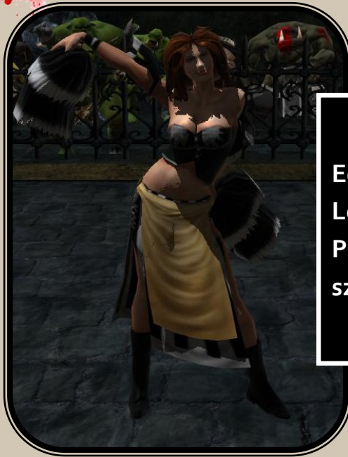
Egy Lelkes Punisher szurkoló

A pálya másik felén eközben egy kis csetepaté alakult ki Lilith a boszorkányelf és Edgar a pusztító között, melynek végeredményeképp Lilith kilökte Edgart a pályáról, akit a szurkolók elég fájdalmasan megtapostak, SenkifiaSenki edző azonnal az orvosért küldött aki sikeresen ellátta a játékos sebeit és a pálya szélén várta a továbbiakat. Eközben Sötétszívű Flyonth köré a Punisher Fun Club játékosai gyűrűt fontak, a lenti részről megindult az elf felmentő sereg. Több elf játékos érkezett a rohamozó segítségére, Adalane akkora lendülettel, hogy Hildred Alban-t azonnal le is kellett vinni a pályáról, becsípődött ideggel. Flyonth megkísérelt egy cselezést, de hanyatt esett, a labda pedig leginkább ki... A kezéből. Wolfgang Wulf ember rohamozó indult volna meg érte, de neki sem jött össze a cselezés része a dolognak, szintén dobott egy hátast. A