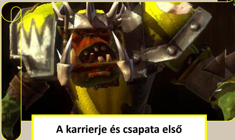
A karrierje és csapata első touchdown-ját szerző Gutzla

A középkezdésnél mindkét oldalon 10-10 játékos sorakozott fel. Az orkok nem a legszerencsésebb felállást választották, ugyanis szabadon hagyták a széleket, amit mint tudjuk, nem jó előjel a villámléptű ellenféllel szemben. A magasra rúgott lasztit Makhag ölelte magához szorosan, de pár pillanattal később már az ellenfél támadott egy balul sikerült blokkolási kísérlet után. A patkányok végigiszkoztak a széleken, egészen a labdát birtoklóig, akit egy rohmozás után Knerlut vitt a földre. A pattogó játékszerre, pedig ismét villámgyorsan csapott le Crytuk. Úgy tűnt sima TD lesz. Hát nem így alakult. Egy újabb önzetlen passzal próbálta volna a viharférgyet játékba hozni, aki azonban megbotlott saját lábában és kábultan terült el a földön. Más választás nem lévén így Crytuk egyedül sétált be a zónába. Ezzel véget is ért az első félidő. 0-2